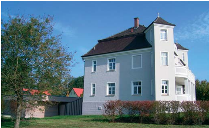
Baronessvilla mit angegliedertem Pavillon

Das traditionsreiche Hohenkammer ist eine sehr lebendige Gemeinde mit einer über 1.200-jährigen Geschichte. Es liegt eingebettet im landschaftlich reizvollen Hügelland des Glonnals, 30 km nördlich von München im Westen des Landkreises Freising, wenige Kilometer entfernt von der Autobahn A9 München-Nürnberg. Die umliegenden Felder und Wälder laden zum Rad fahren, Joggen oder Wandern ein. Golf und Tennis sind in der nahen Umgebung möglich.